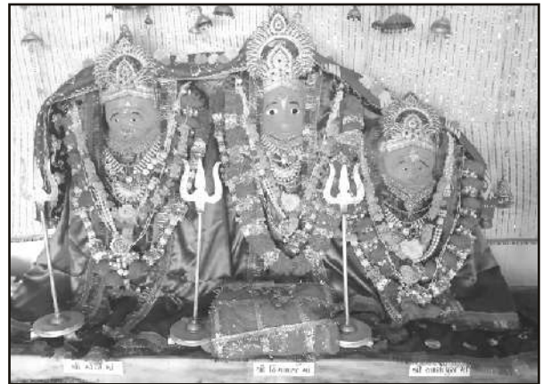
આશાર માતાજીનું મંદિર, લાયજા - કચ્છ.